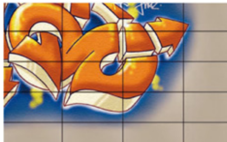
Graffiti lässt sich vom Fassadenziegel TONALITY® leicht entfernen

TONALITY® Classic Fassadenziegel mit veredelter Oberfläche verfügen über einen dauerhaften und effizienten Graffiti-Schutz. Im „KERALIS“-Verfahren wurde der Graffiti-Schutz gleich mit eingebrannt. Die Schutzwirkung besteht vom ersten Tag an, also auch in der Bauphase. Es ist kein Auffrischen oder Erneuern des Schutzes, wie bei herkömmlichen Systemen, erforderlich. Der TONALITY® Graffiti-Schutz hält ein ganzes Produktleben lang. Bei herkömmlichen Systemen muss ein Graffiti-Schutz nachträglich aufgebracht werden, es handelt sich meist um eine wachartige Schicht, die den Ziegel im Glanzgrad verändert und oft zu Fleckenbildungen führt. Außerdem verliert die Schicht nach ca. 3 Jahren ihre Wirkung und muss erneut aufgetragen werden. Der TONALITY® Graffiti-Schutz muss nicht erneuert werden. Sollte es zu Verunreinigungen mit Graffiti kommen, so können Sie diese leicht „wegwischen“. Wir empfehlen Ihnen hierzu eine leicht alkoholhaltige Lösung oder einem Graffiti-Entferner, z.B. P3 Scribex 400 der Fa. Henkel.