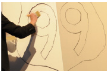
Das Graffito wird mit dem Graffiti-Entferner großzügig eingespült.

Die Fassadentafeln Pictura und Natura PRO erhalten in der Produktion eine zusätzliche UV-gehärtete PRO-Oberflächenbeschichtung. Diese bietet eine hohen Schutz gegen gebräuchliche Farben und Sprühlacke. Die PRO-Oberflächenbeschichtung erfüllt die Forderung der Einstufungsprüfung und die des Prüfzyklus 2 der „Gütegemeinschaft Anti-Graffiti e.V.“ für oberflächengeschützte Anti-Graffiti-Systeme. Graffitis können mit handelsüblichen Graffitientfernern beseitigt werden. Reiniger mit leicht flüchtigen Lösungsmitteln dürfen nicht verwendet werden. Pregernig Consult empfiehlt hierzu „Rasant 031“. Die gelösten Farben werden mit einem mildalkalischen Zusatz im Reinigungsmittel entfernt, z.B. Arrow Plan.