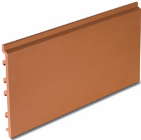
Fassadenziegel TONALITY® Classic oberflächenveredelt

nes Hauses berücksichtigt werden. So kann z.B. das Erdgeschoss eines Hauses mit Produkten mit Graffiti-Schutz gestaltet werden, und die darüber liegenden Geschosse ohne.